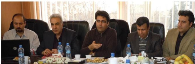
تسهیل پروسه یافتن واحدهای غیر مجاز و قانون گریز در پس کوچه های اصفهان ۳